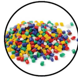
PPS 3 Materiais POLIMÉRICOS