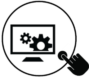
PPS 4 Metodologias e Sistemas DIGITAIS