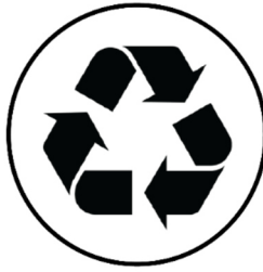
PPS 5 Desafios ECONÓMICOS, SOCIETAIS e AMBIENTAIS