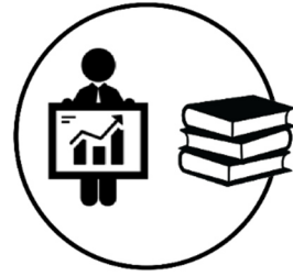
PPS 6 GESTÃO do Projeto e DISSEMINAÇÃO Técnico-Científica