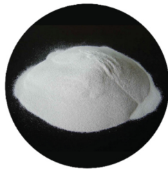
PPS 2 Materiais CERÂMICOS e CIMENTÍCIOS